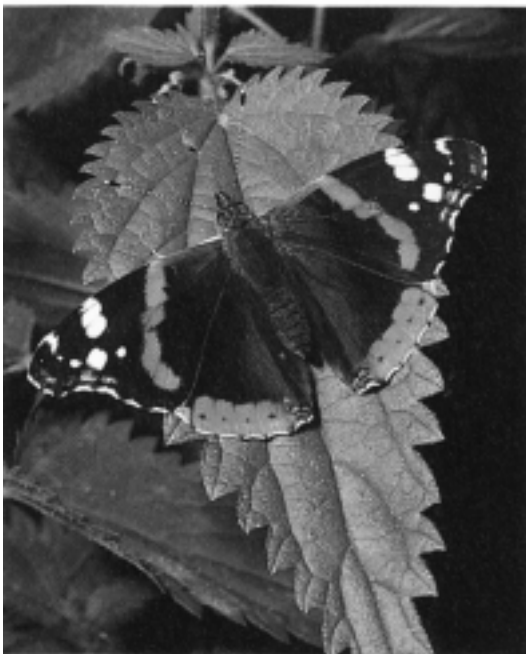
Admiral auf einem Brennesselblatt

Dem rot-schwarz-weissen Admiral ( Vanessa atalanta L.) und dem gescheckten Distelfalter begegnen wir in unseren Gärten immer wieder. Wer vermutet wohl in diesen zarten Schmetterlingen grosse Reisende, welche weite Strecken zurücklegen? Kaum vorstellbar – so ein kleiner Schmetterling soll bis Afrika fliegen können? Über die Alpen und das Meer? Die Schüler staunen wenn ich ihnen das erzähle. Nun labt sich schon wieder ein Admiral am Saft des Fallobstes. Die warme Septembersonne lässt seine Flügel leuchten. Bald wird bei uns der erste Frost die Natur an den Winter erinnern. Und der Schmetterling? Er ist auf dem Weg nach Süden durch Bergtäler und über Pässe. Bald wird er am Meer sein und es nach Nordafrika queren. Dort wird er Eier legen, welche die Raupenzeit durchentwickeln, sich verpuppen und dann im Frühling wieder den Weg nach Norden antreten.