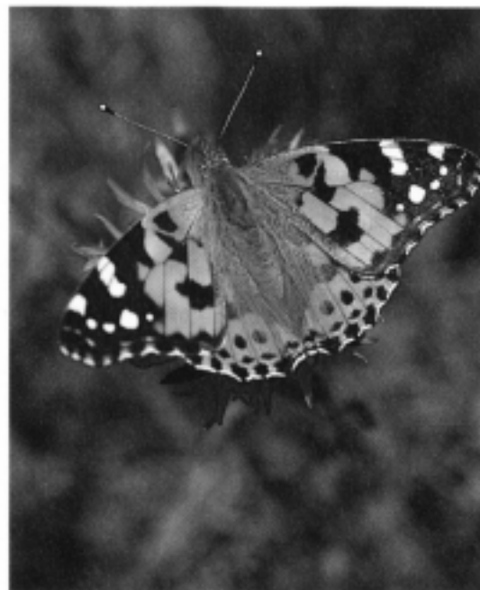
Distelfalter auf Flockenblume

Wenn wir dieses Phänomen der Schmetterlingswanderungen auf uns wirken lassen, so können wir nur staunen und wenig verstehen. Viele Fragen sind auch für die Wissenschaft offen. Der zarte Schmetterling – und mit ihm das ganze Insektenvolk – entziehen sich unserem kausalen Verstehen.